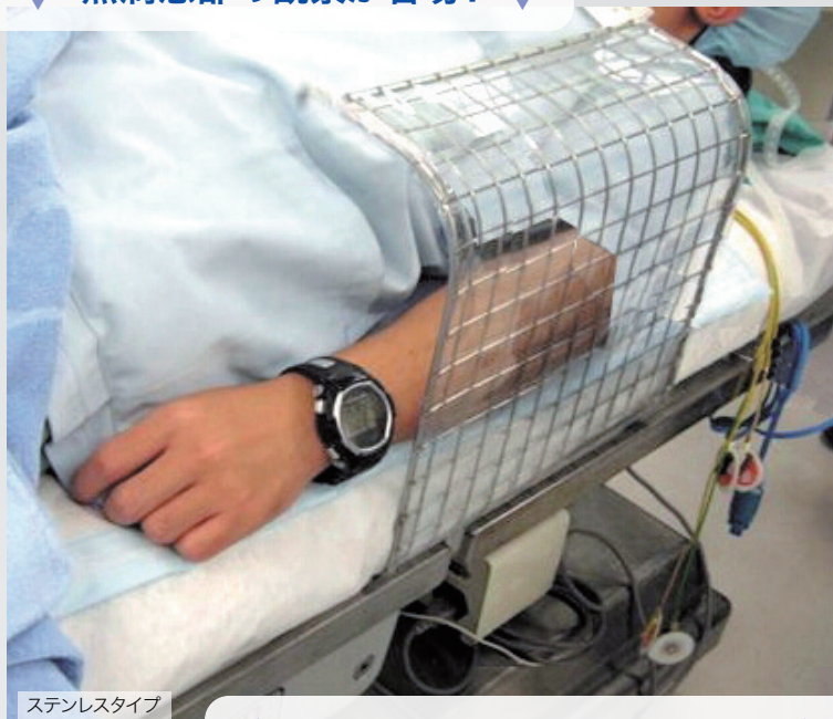
ステンレスタイプ